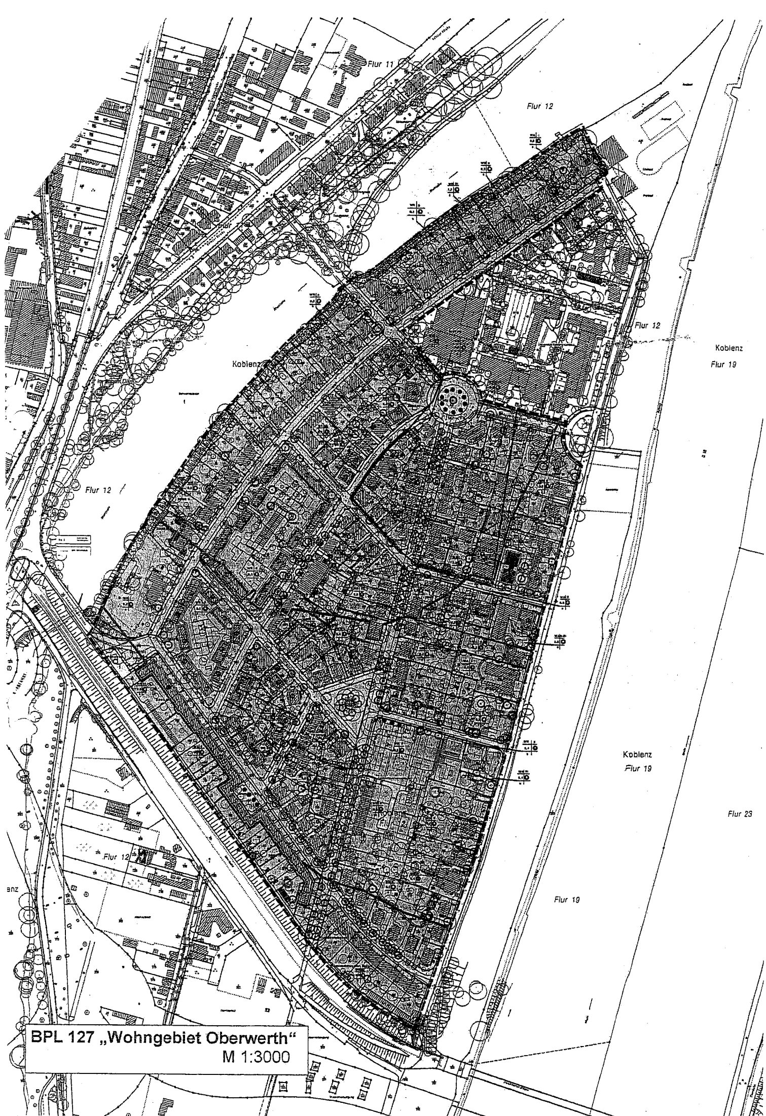
BPL 127 „Wohngebiet Oberwerth“ M 1:3000