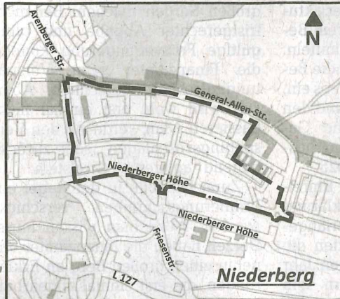
Orientierungsskizze Bebauungsplan Nr. 293