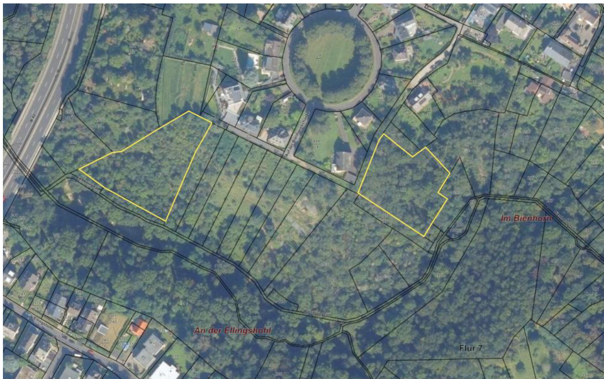
Abbildung 1: Flächen für die Entwicklung von neuen Mauereidechsen-Lebensräumen (Darstellung Sweco, Dezember 2023)